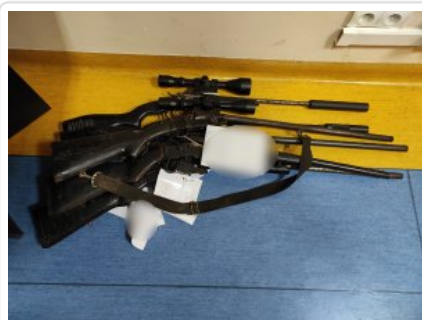
Zabezpieczona przez policjantów broń